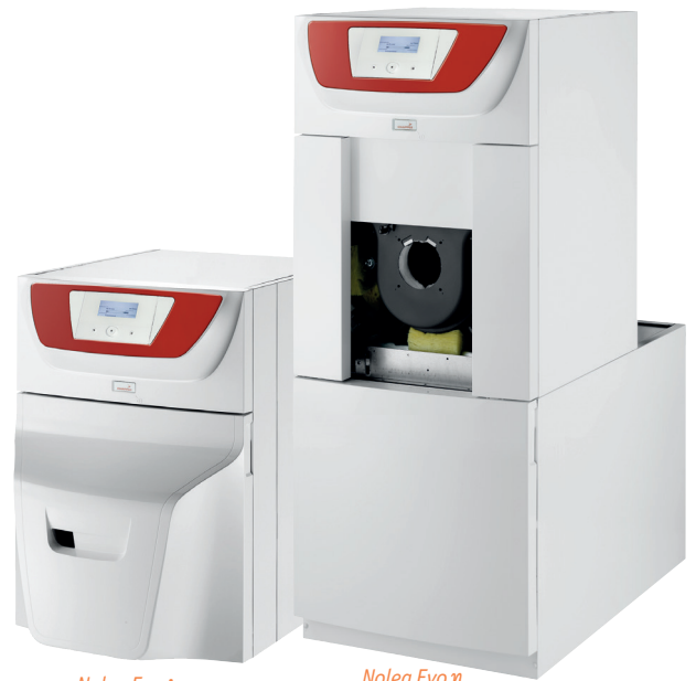
Nolea Evo i